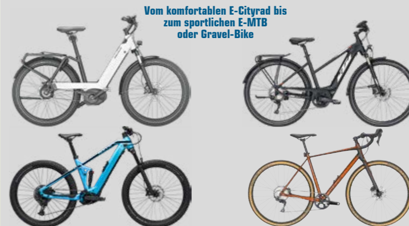
Vom komfortablen E-Cityrad bis zum sportlichen E-MTB oder Gravel-Bike

3 Bike abholen und losradeln Jetzt können Sie 36 Monate sorglos radeln. Denn der maßgeschneiderte Rundum-Schutz bietet höchstmögliche Sicherheit und besten Service. Nach Ende der 36-monatigen Laufzeit können Sie das Rad zu einem niedrigen Restkaufwert erwerben.