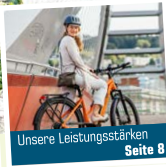
Unsere Leistungsstärken Seite 8

In Zusammenarbeit mit den führenden LEASING-Anbietern: