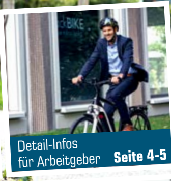
Detail-Infos für Arbeitgeber Seite 4-5